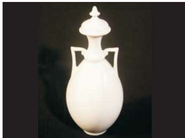
Deckelvase - 80 €