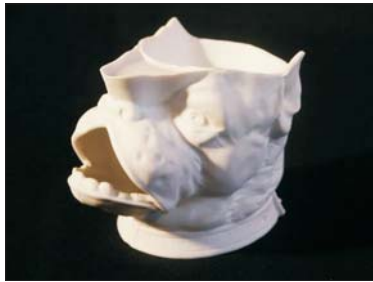
Rasierbecher - 180 €