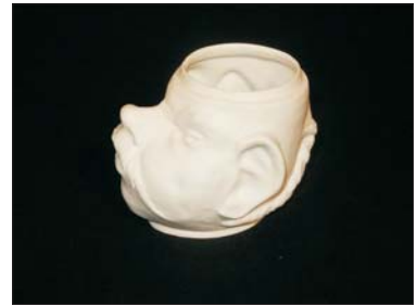
Rasierbecher - 180 €