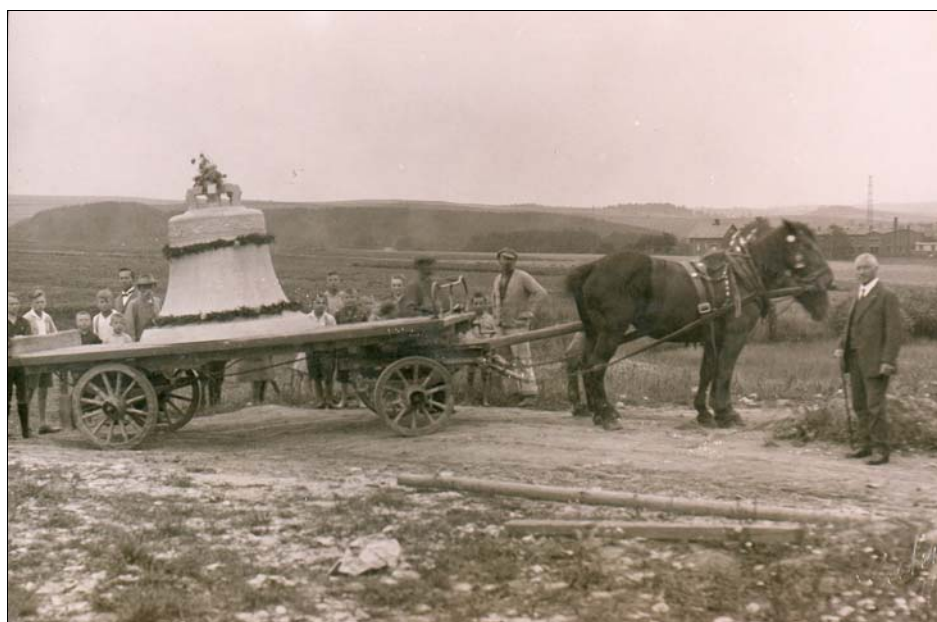
Bild 37 – Lieferung der Glocke für die Auferstehungskirche – rechts, Otto Reinecke