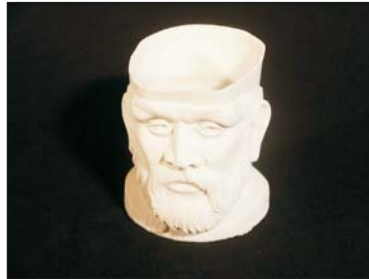
Tabatiere - 180 €