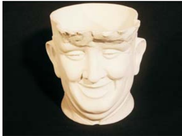
Tabatiere - 250 €