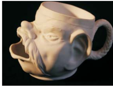
Rasierbecher - 180 €