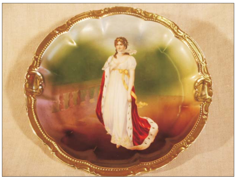
WT - 120 €